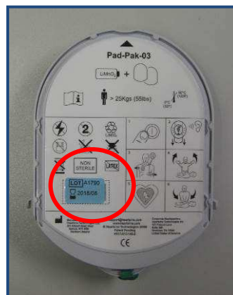
Etikett auf Pad-Pak