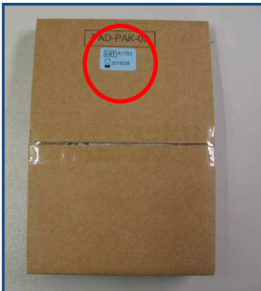
Etikett auf Pad-Pak-Karton