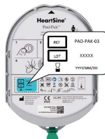
Abbildung 2 – Verfallsdatum des Pad-Paks