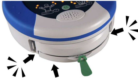
Abbildung 3 – Ein Pad-Pak einlegen