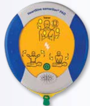
HeartSine samaritan PAD 360P Trainer (TRN-360-xx)