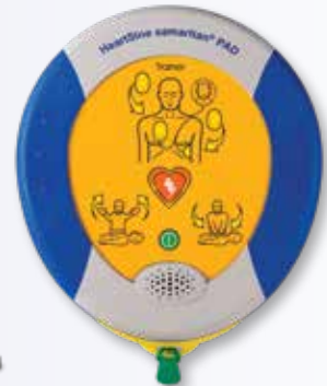
HeartSine samaritan PAD 350P Trainer (TRN-350-xx)