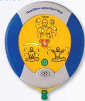
HeartSine samaritan PAD 500P Trainer con simulación de frecuencia CPR Advisor (TRN-500-xx)